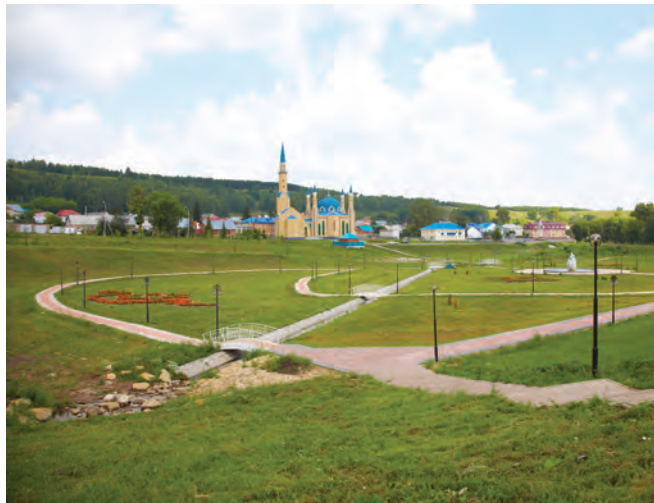
Парк Любви «Махаббат».