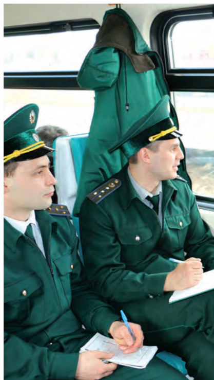
Экологи систематически объезжают пригороды Казани.

Традиционный железнодорожный объезд по пригородам Казани в этом году прошел дважды. В первый раз из окон поезда было зафиксировано 44 нарушения. В основном это были не-