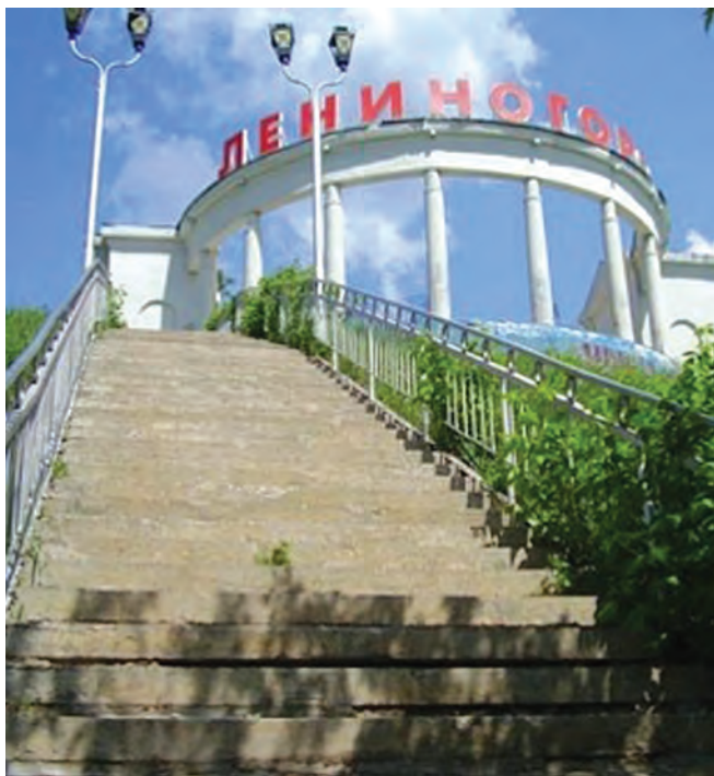
Главная достопримечательность города – ротонда.

2007 год вошел в историю Татарстана как год добычи трехмиллиардной тонны татарстанской нефти. Из этих трех миллиардов пятая часть добыта лениногорскими нефтяниками. Наряду с «Лениногорскнефтью» у нас в течение многих лет функционировало также НГДУ «Иркеннефть». Кроме того, на территории района черное золото добывает и НГДУ «Елховнефть». С учетом всего этого можно представить себе вклад лениногорской земли в достижения республики!