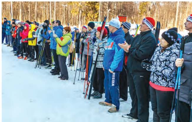
Соревнования по лыжным гонкам в рамках Спартакиады муниципальных служащих Республики Татарстан.

раолимпийцев. В Сочи Рушан Миннегулов завоевал две золотые и одну серебряную медаль, Марта Зайнуллина стала бронзовым призером Паралимпийских игр. Александр Бурмистров и Евгений Медведев стали чемпионами мира по хоккею, трое наших игроков выиграли чемпионат мира по хоккею с мячом.