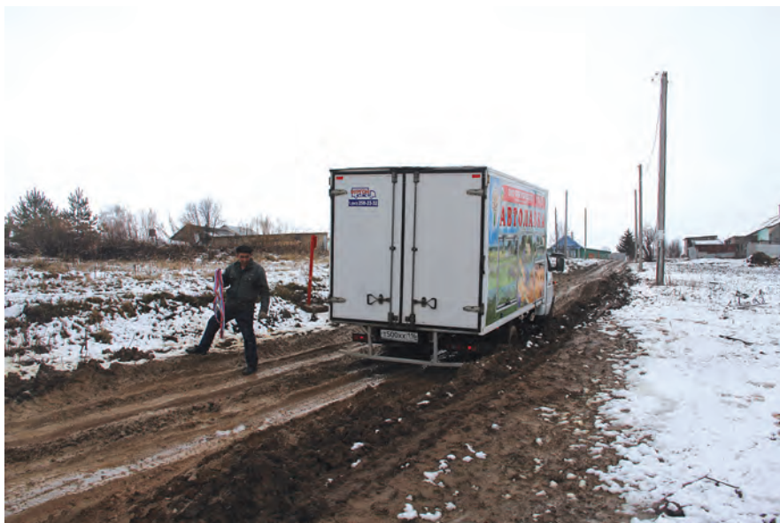
Автолавка ждет подмоги.

На деньги, собираемые населением, а также республиканские субсидии огородили несколько кладбищ и построили несколько сот метров уличных щебеночных дорог. Программа пришлась жителям района по душе, они увидели реальные результаты, поэтому в августе прошлого года вновь состоялись референдумы, участники которых решили собрать уже по 200 рублей с человека. К собранной сумме уже добавились республиканские деньги, и сегодня идет их освоение.