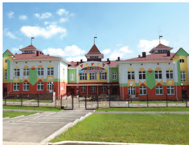
Детский сад «Родничок».

Сельхозпроизводители обрабатывают 74 тысячи гектаров пашни. Ежегодно засеивается более 35 тысяч гектаров зерновых культур, возделывается 20 тысяч гектаров кормовых культур, выращивается сахарная свекла и картофель. Лениногорский район специализируется на мясо-молочном