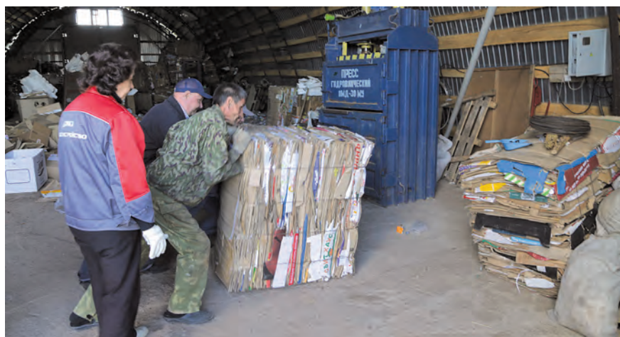
Мусоросортировочная станция на полигоне ТБО пгт Джалиль.

В 2009 году на полигоне ТБО поселка было построено здание под мусоросортировочную линию, а благодаря помощи руководства района и нефтяников были изысканы средства на приобретение оборудования, дополнительных мусоровозов и контейнеров. Теперь предприятие занимается селективным сбором твердых бытовых отходов.