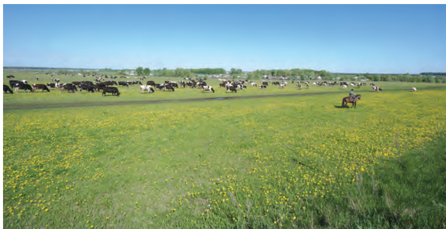
В ближайшие годы количество КРС должно достигнуть 40 тысяч голов.

– Животноводство сегодня является для сельчан основным источни-