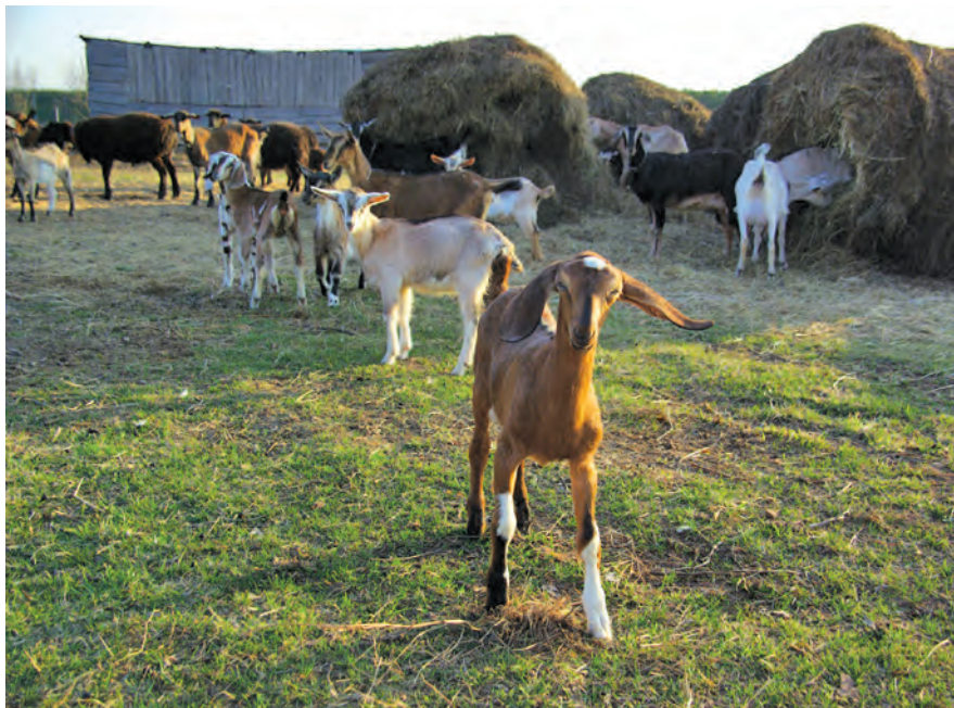
Фермеры содержат в основном две породы коз – альпийскую и нубийскую.

пользуют и для продажи своих животных. По городу совсем не скучают. Из городских привычек осталось, пожалуй, только катание на беговых и горных лыжах. Деревенские на лыжах не катаются, говорит Юрий.