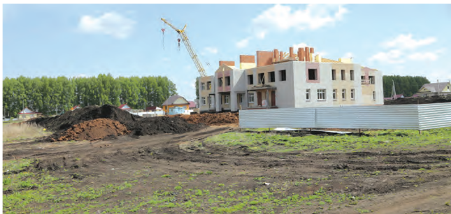
До начала нового учебного года в строящемся микрорайоне райцентра откроется детский сад на 140 мест.