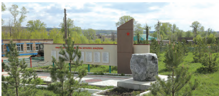
В преддверии 70-летия Великой Победы в Кутемели на спонсорские средства привели в порядок мемориальный комплекс и прилегающий к нему парк.

Новоимяны не сидят сложа руки, полагаясь только на помощь со стороны. Одними из первых в республике в поселении с 2013 года активно включились в реализацию программы самообложения. Собранные в ее рамках деньги потратили на ремонт моста через речку Камышлы в селе Кутемели, прокладку дороги к кладбищу соседней деревни, приведение в порядок свалок, очистку улиц сельского поселения в зимний период. Кроме того закупили для двух деревень мотопомпы и электрический отбойный молоток.