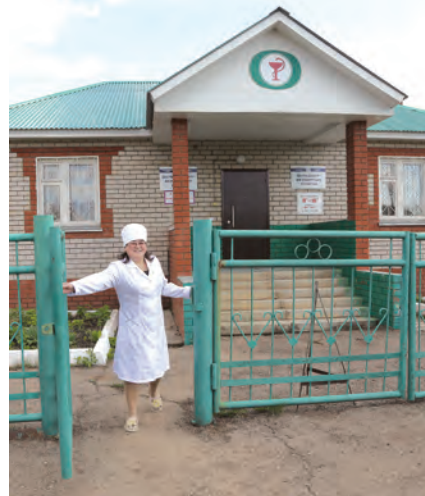
ФАП больше напоминает амбулаторию и по площади, и по количеству оказываемых услуг.

села Кутемели, Новый Имян, деревни Буралы-Чишма, Ивановка и Таза-Чишма. Здесь сегодня проживает 672 человека, среди них татары, русские, кряшены, чувашаи.