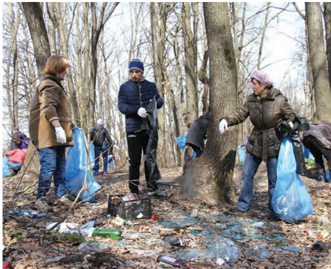
Во время двухмесячника уборка прошла не только во дворах.