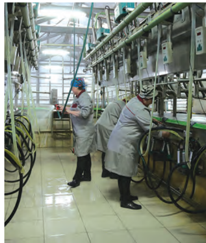
Технологичный доильный зал.