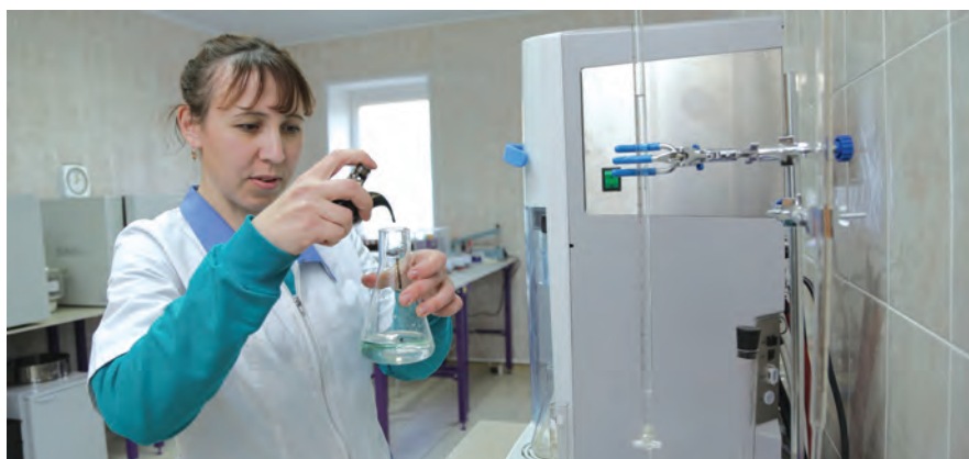
С конца прошлого года в райцентре действует комплексная модульная лаборатория по исследованию кормов.