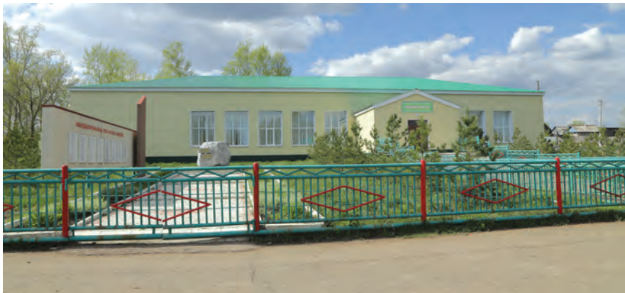
Дом культуры в селе Кутемели.

Вновь испытает удачу в конкурсе и Новоимьянское сельское поселение Сармановского района, объединяющее