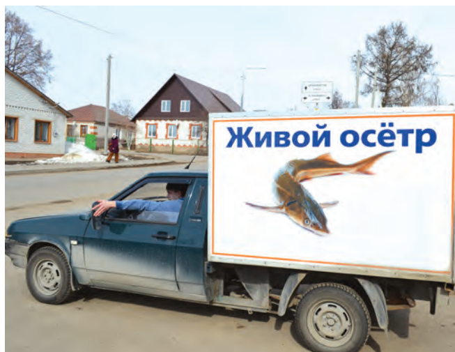
В 2014 году КФХ «Батыршин И.И.» реализовало 3 тонны продукции.

А вот на работу цеха по выращиванию товарной рыбы осетровых пород, расположенного на территории промплощадки «Лаишево» Лаишевского района, сезонные погод-