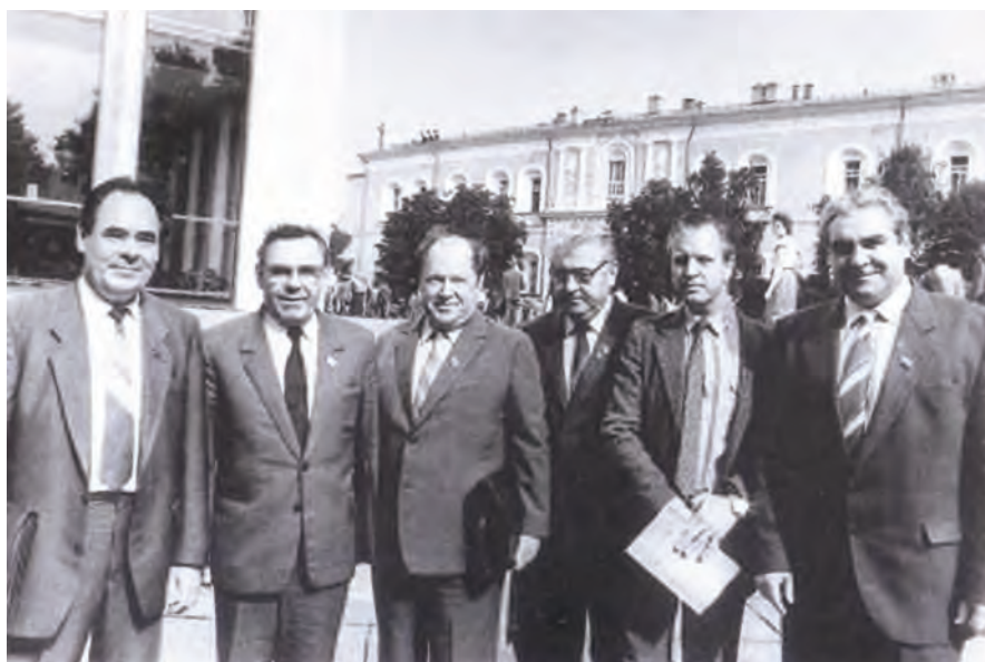
Делегаты партийного съезда.

В начале 1990-х, накануне развала колхозов, интуиция руководителя подсказывает ему новый способ устройства жизни сельчан: молодняк животных раздают людям в аренду, а когда животные подрастают, сельчане получают полагающиеся за свою работу деньги. В тот год район заработал 25 миллионов рублей чистой прибыли.