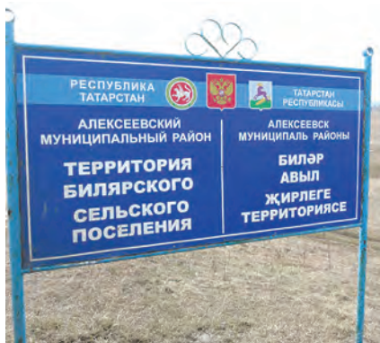
Билярск можно назвать показательным в плане наведения чистоты.