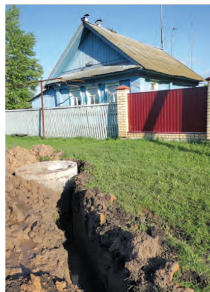
В нынешнем году планируется проложить водопровод в четырех селах района.

Буквально на днях в селе Татарские Суксы заработал новый модульный ветеринарный пункт, а в конце апреля в селе Старое Байсарово и деревне Чуганак открылись соответственно врачебная амбулатория и модульный ФАП. В настоящее время в селе Атысево завершается строительство сельского клуба на 200 мест.