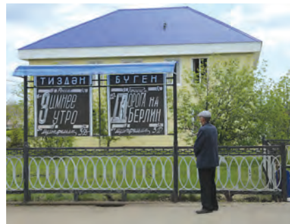
Благодаря реконструкции кинотеатра, проведенной нефтяниками, в Джалиле теперь можно смотреть фильмы в 3D-формате.

В целом здесь установлено обязательное для всех правило: «Каждый должен убирать за собой мусор!». Прививать населению экологическую культуру помогают и таблички, призывающие к чистоте и напоминающие о размере штрафа за выброс мусора в неполюженном месте. Они развешаны на видных местах по всему муниципалитету. Поэтому строительных материалов, старой техники и другого хлама возле ворот местных подворий не встретишь.