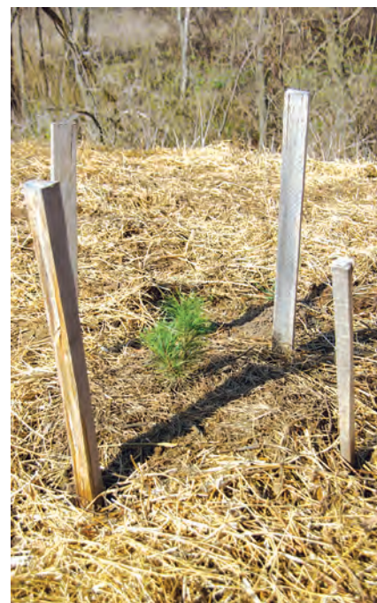
Саженцы пережили свою первую зиму, но когда-то должны окружить усадьбу плотным кольцом.

Недостатка в общении жители обособленного хутора не испытывают. Общаются они много, в основном через интернет. Его возможности ис-