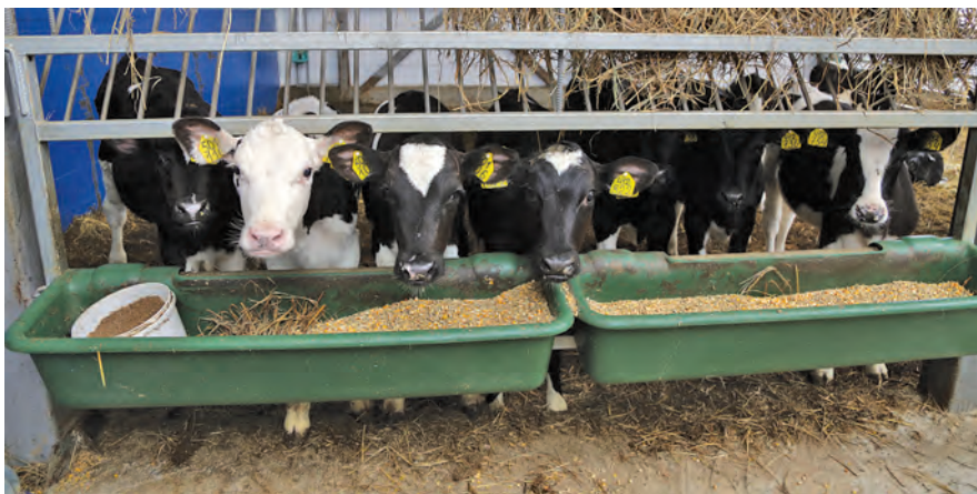
В хозяйствах Атинского района большое внимание уделяют сохранности молодняка.