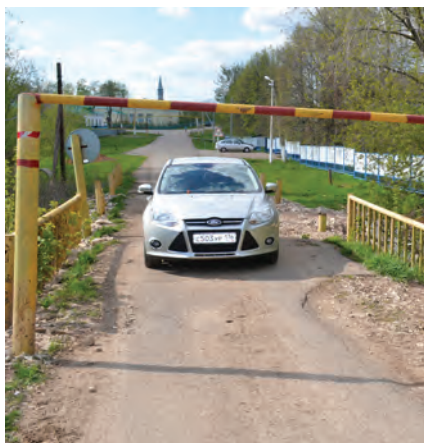
Мост отремонтировали на средства, собранные в результате самообложения.