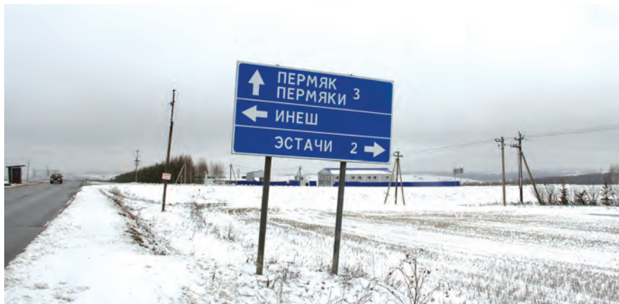
Дорожный знак не даст проехать мимо.