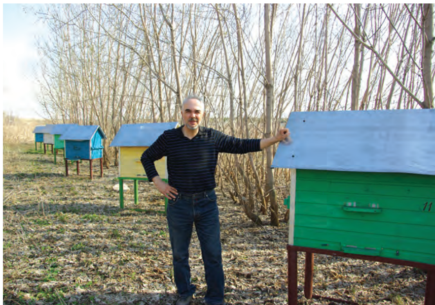
В хозяйстве есть и небольшая пасека.

лись на лысую кочку со старым домом, чтобы снова начать с нуля. Родители в очередной раз недоумевали: да что же вам на одном месте не живетесь? Но Гостицы понимали: дом можно построить новый, а вот такой подходящий участок свободной земли найти с каждым годом будет все сложнее.