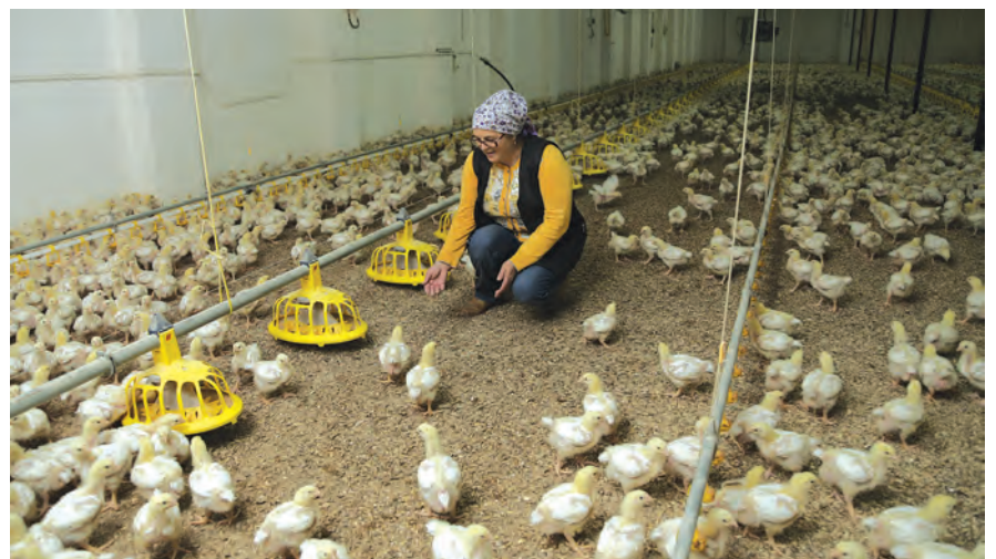
КФХ активно занимаются птицеводством.

Местный бизнес активно осваивает сферу пищевой промышленности.