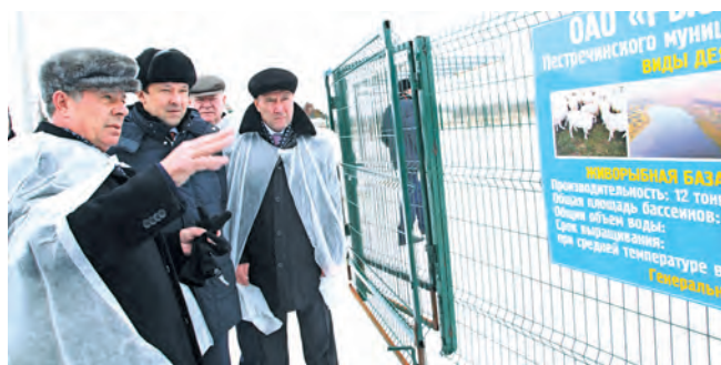
Посещение Премьер-министром РТ Ильдаром Халиковым ОАО «Рыбхоз «Ушня» Пестречинского района. Февраль 2014 года.

В Татарстане действуют 60 рыбозводческих хозяйств различных форм собственности, пять из которых являются специализированными прудовыми предприятиями. Среди них – ООО «Арский рыбхоз», ОАО «Рыбхоз «Ушня» Пестречинского района, ОАО «Кайбицкий рыбхоз», ОАО «Рыбхоз «Дымка» Бавлинского района, ОАО «Заинский рыбхоз». Производством мальков, личинок, молоди и другого рыбопосадочного материала занимается ООО «Заинский рыбопитомник».