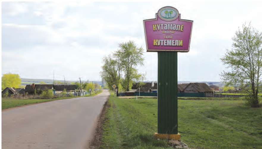
Аншлаг при въезде в Кутемели.

Основную часть призовых муниципальные образования обязаны направить на дальнейшее развитие жилищно-коммунального хозяйства и повышение благоустроенности населенных пунктов. Лишь до 10 процентов средств могут быть использованы для премирования работников организаций, добившихся наиболее высоких результатов в сфере ЖКХ и благоустройства.