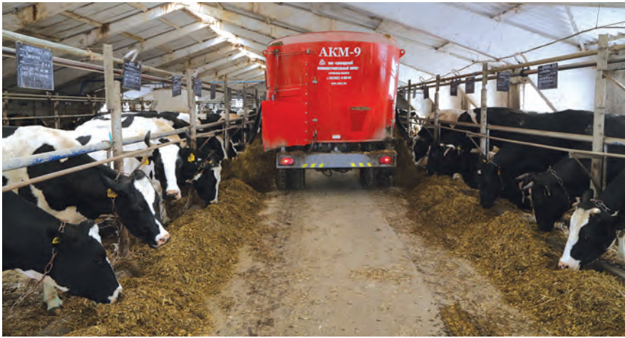
На смену вилам в хозяйствах района давно пришли миксеры-кормораздатчики.