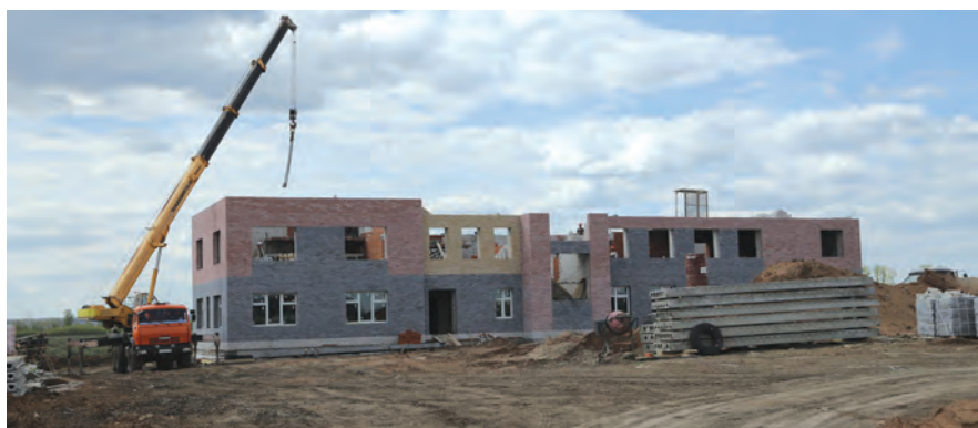
К концу августа в Сарманово сдадут в эксплуатацию современный детский сад на 120 мест.

но ремонтируются социальные объекты, развивается инфраструктура, совершенствуется архитектурный ансамбль райцентра. Вся территория муниципалитета сверкает чистотой: согласно генеральной схеме очистки, мусор и отходы в организованном порядке вывозятся на полигон ТБО.