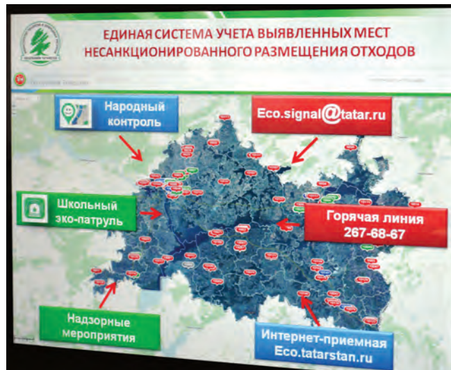
Все места несанкционированного размещения отходов заносится в геоинформационную систему ГИС «Экологическая карта».

Вы не увидите на наших улицах ни тракторов, ни тележек, ни куч навоза, ни разбросанных дров.