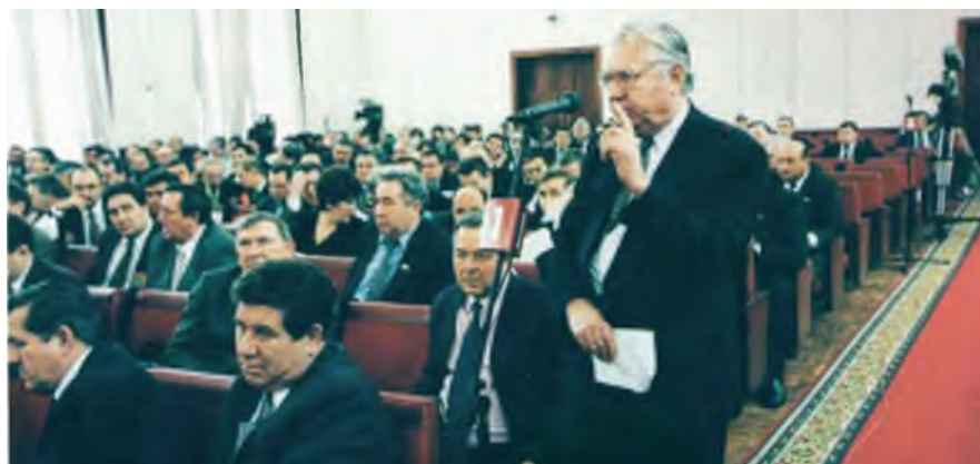
На сессии Верховного Совета Татарстана.