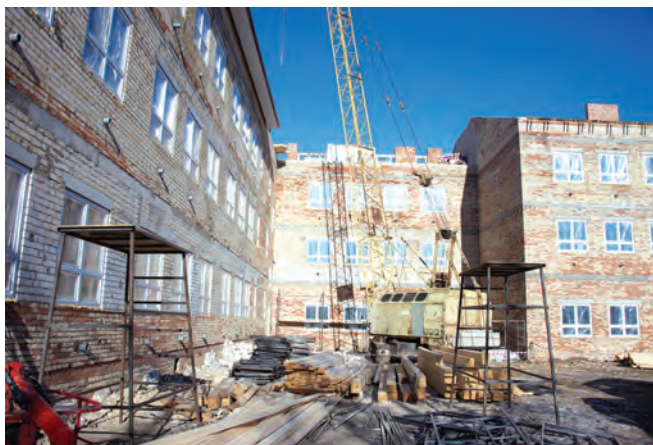
Строительство городской школы №2.

Желаю вам, дорогие земляки, новых свершений и успехов в добрых начинаниях. Пусть в каждом доме царит благополучие и счастье!