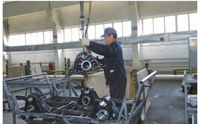
ЗАО «Актанышский агрегатный завод» было образовано в марте 2006 года на площадях обанкротившегося предприятия «Сельхозтехника» в селе Актаныш.

Одной из составляющих рациона крупного рогатого скота является рапсовый жмых. Пока ташкыновцы покупают его на стороне. Однако уже осенью этого года в сельхозпредприятии благодаря финансовой поддержке района запустят работу модульного рапсового завода мощностью 15 тонн биодизеля в сутки. Это позволит муниципальному образованию решить вопрос переработки важного масличного растения и начать постепенный перевод парка сельхозмашин на биологическое топливо.