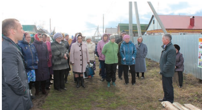
Нурлатның Тимерьолчылар микрорайонындагы 9нчы ТИҮндә жылыш.

хужалыкларда гына да МЭТнең баш саны 259 га күбәйгән.