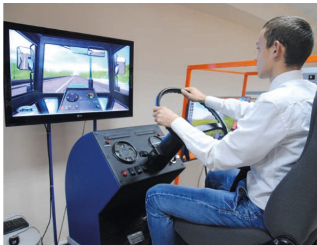
Сарман аграр колледжындагы уку стенд-тренажерлары.