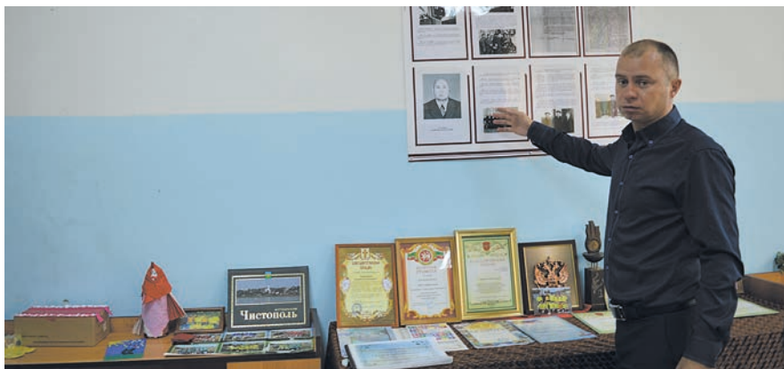
«Кирпичный» микрорайонында ТИҮ үзәк күрә бер мәдәни үзәккә әверелә – бер түбә астында ижтимагый, спорт һәм дини эшчәнлек тормышка ашырыла. (Фотода: Андрей Сашин.)

Шулай итеп, ТИҮ микрорайонның үзенә күрә мәдәни үзәгенә әверелгән – бер түбә астында ижтимагый, спорт һәм дини эшчәнлек тормышка ашырыла.