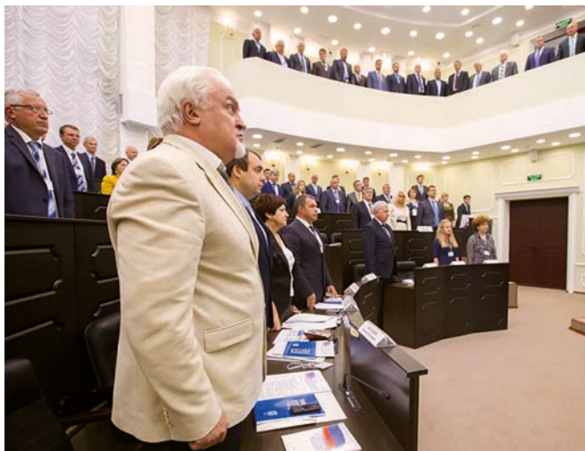
Үзәк федераль округтагы киңәшмә (Тамбов, 2015 елның сентябре).

Төбәкләрнең һәм муниципалитетларның финанс мәсьәләләрен хәл итү – төп һәм иң катлаулы мәсьәлә булып кала бирә. Монда гади исәп-хисап алып бару гына житми, ә ЖҮИгә карата кызыксындыру уятучы бюджет-салым сәясәте кулланырга кирәк. Шуннан башка булмый. Муниципалитетлар үзләрен кеше жылкәсендә утыручылар итеп түгел, ә илнең социаль-икътисадый үсешендә актив катнашучылар, тулы хокукка ия хужалык итүче субъектлар итеп тоярга тиеш.