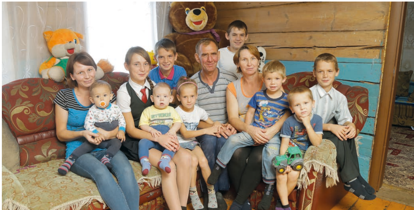
Олег ПЛАТОНОВ тексты.