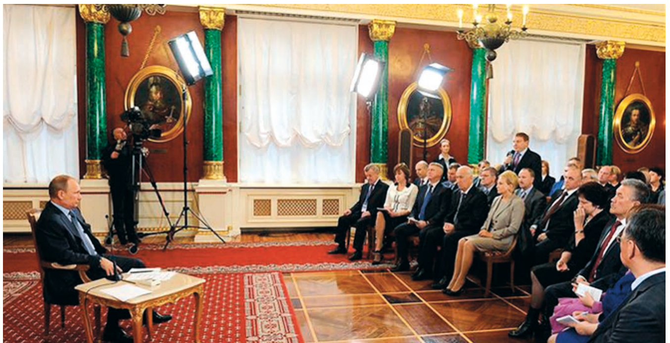
РФ Президенты В.Путинның Бөтенроссия муниципаль берәмлекләре съездында катнашучылар белән очрашуы (2013 елның ноябре).

Минемчә, жирле үзидарә эшчәнлегенең нәтижәле тәэмин итәрлек закон базасы формалашкан, әмма бу барлык иске проблемалар хәл ителде, дигән сүз түгел. Жирле үзидарә органның вәкаләтләре өлкәсен тәртипкә салырга кирәк. Ә иң мөһиме: алдыбызда жирле хакимиятне тотрыклы финанслар белән тәэмин итү мәсьәләсе тора.