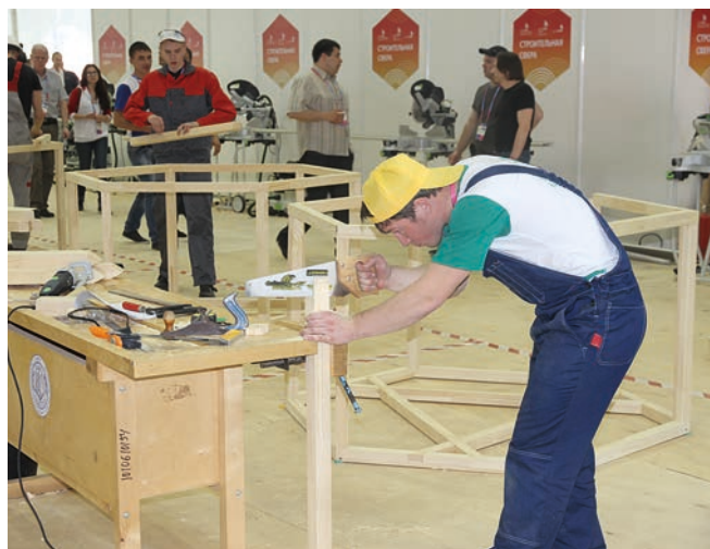
Быел май ае ахырында Казанда WorldSkills стандартлары буенча III Милли һөнәри осталык чемпионаты булып узды.