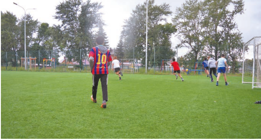
ТИҮ ярдәме белән яңа спорт һәм балалар майданчыгы барлыкка килгәч, шикләнүләр юкка чыга, халык микрорайон тормышында барлыкка килгән яңа күренешкә җитди карый башлый.

инициативалы кешеләргә ТИҮ бүләкләр һәм рәхмәт хатлары тапшыра. Хәзерге вакытта «Йорт тирәсен иң шәп итеп бизәү» бәйгесе уза, җиңүчегә бүләк – газон чапкыч.