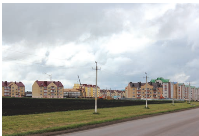
Нурлатта яңа йортлар пәйда була.