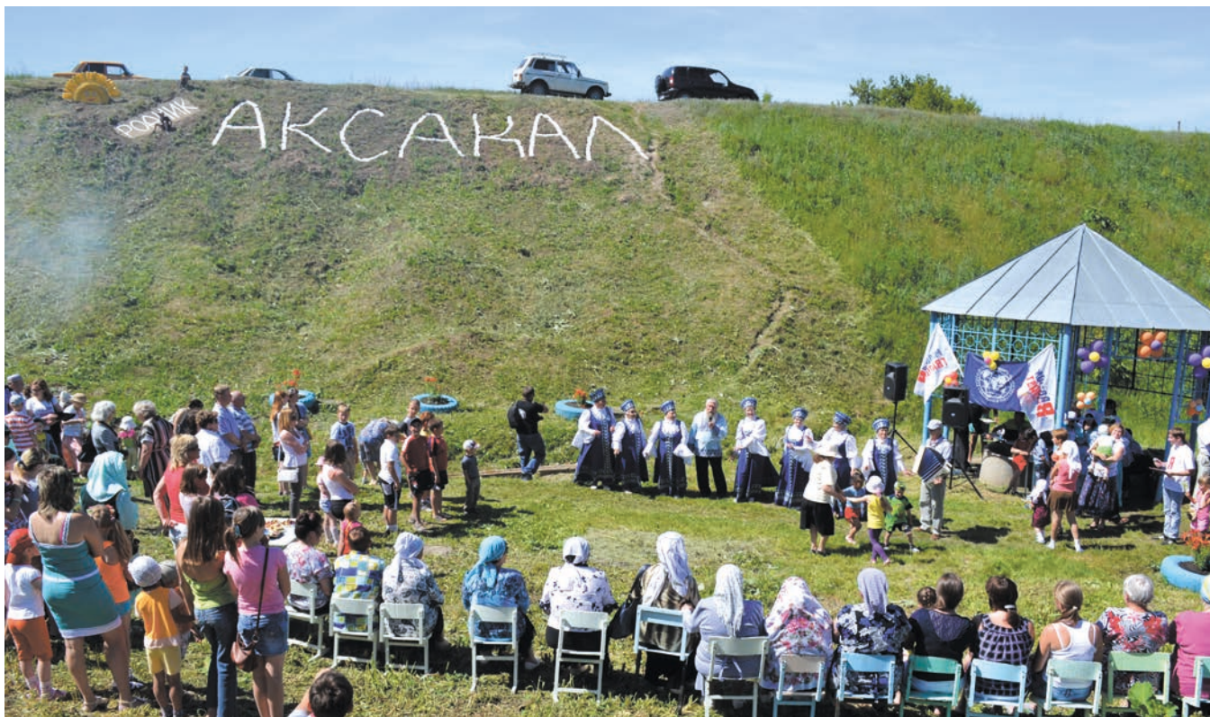
Вероника КӘЛИМУЛЛИНА тексты.