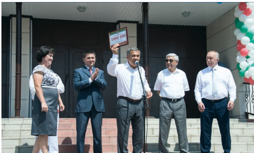
Нурлатта Халыклар дуслыгы йортын ачу тантанасы.

Нурлат районының 26 авыл жирлегендә жәмгысе 59,5 мең кеше яши, нигездә татарлар, руслар, чувашлар. Агымдагы ел нурлатлылар өчен юбилей елы. Ул 1930 елда оештырылган булган, әүвәле Октябрь районы дип йөртелгән, ә 1997 елда атамасы Нурлатка үзгәртелгән.