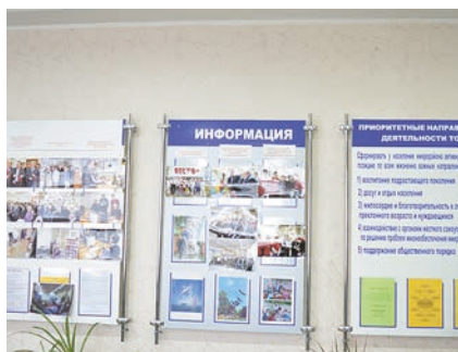
«Вектор» радиоккомпаниясе» микрорайонындагы 5нче номерлы ТИУ үз эшчәнлеген 2012 елның сентябрендә башлап жиберә.

Халык мөрәҗәгәтләре белән эш өзлексез рәвештә алып барыла, моның өчен махсус журнал ачылган. Нигездә, олы яшьтәгә кешеләр мөрәҗәгать итә, аларны йорт тирәләрен һәм балалар