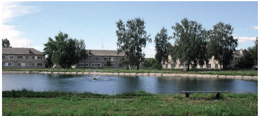
Мәдәният йорты янәшәсендәге зур булмаган күл бистә халкының яраткан ял итү урынына әверелеп килә.

Биектау районында торак пунктларны төзекләндерүгә соңгы елларда зур игътибар бирәләр. Бу эш бигрәк тә 2013 елда, ТР Президенты ТР Муниципаль берәмлекләре Советының гражданның үзара салымын дәүләт тарафыннан «1гә 4» нисбәтендә финанслау про-