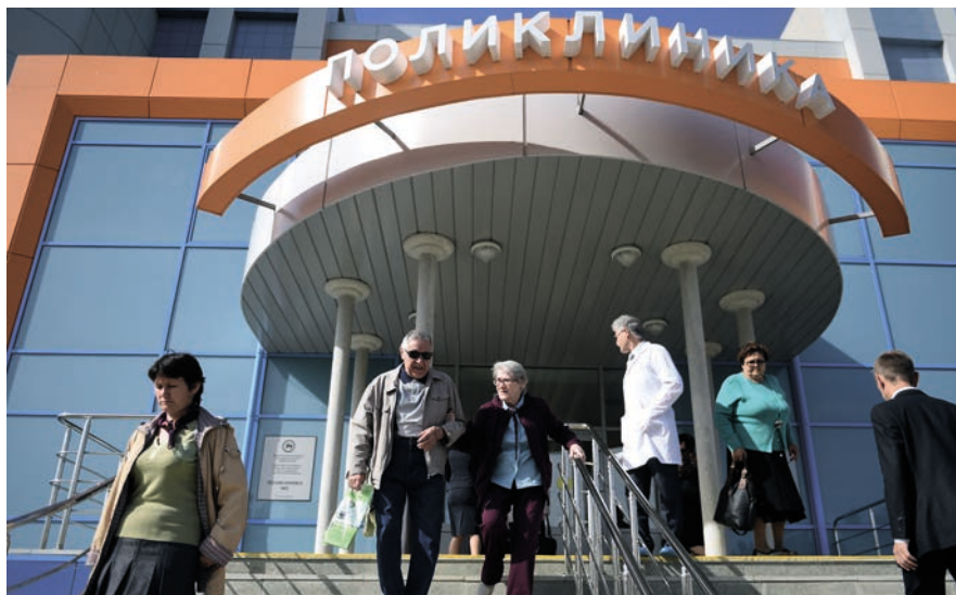
Узган ел шәһәрдә өр-яңа 2нче дөваханә ачылган.

Габдулла Тукай исемендәге яңартылган уку һәм ял паркына да халык югары бәя бирә. Аны