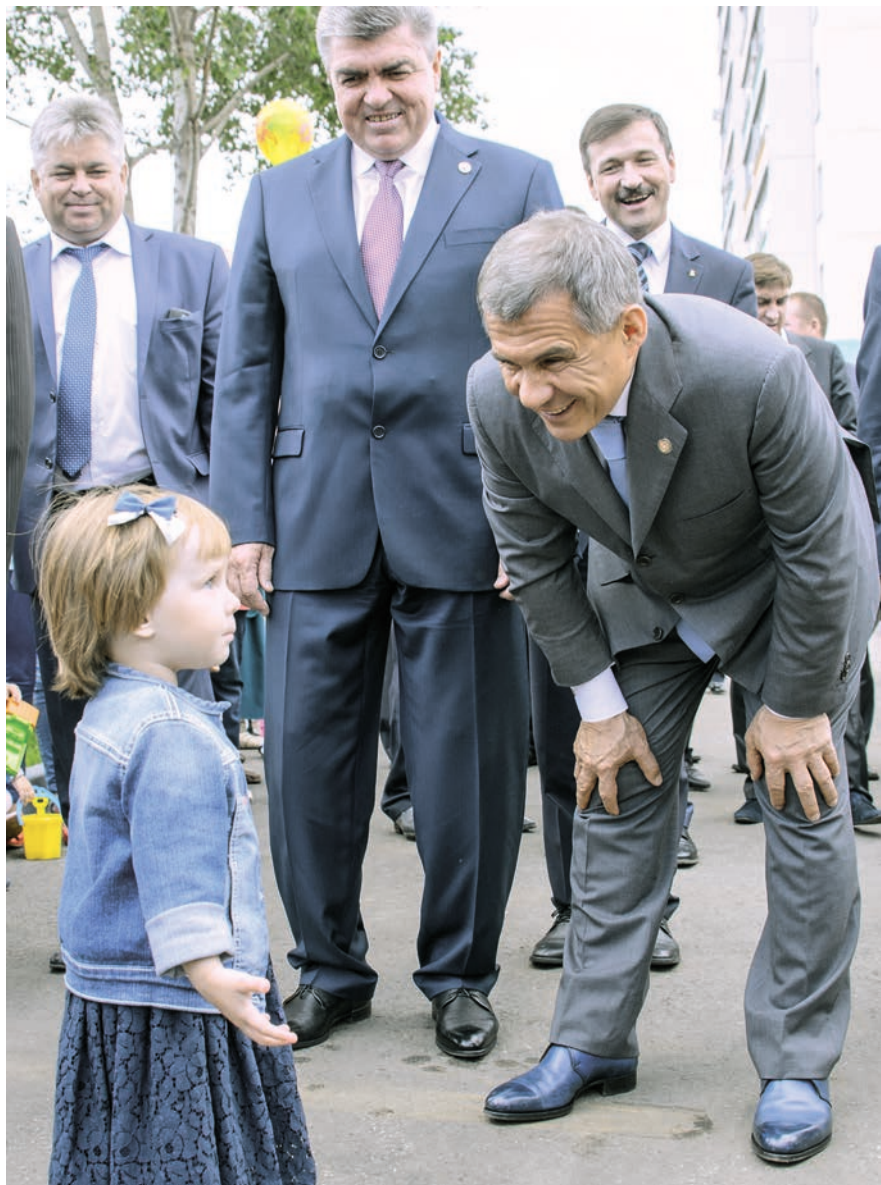
«Челнинская мозаика» балалар бакчасының тантаналы ачылышында Татарстан Президенты Рөстәм Миңнеханов катнашты.

– Без хәзер яшь планкасын яшь ярымга кадәр киметә алабыз, –