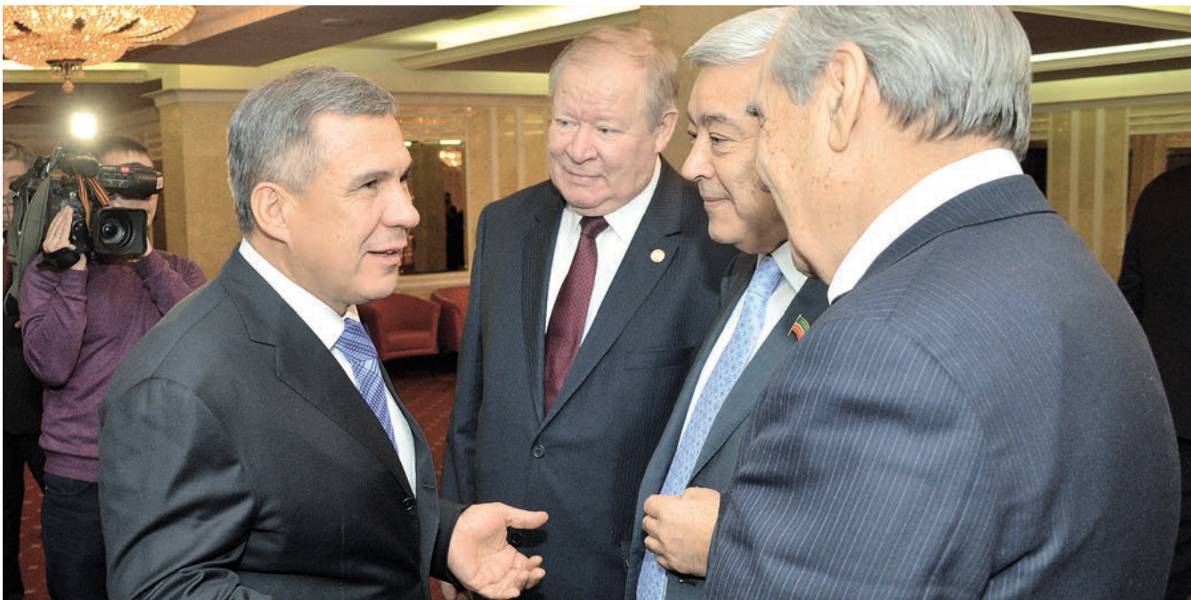
Республика житәкчеләре жирле үзидарәнең Татарстан үсешендәге ролен яхшы аңлыйлар.

руча көнүзәк мәсьәлә ул, анда яшәүчеләр ақчаларны жыюда теләп катнаша, чөнки аларның барысы да нәкъ менә үз авылларында яки бистәләрендә аның нинди максатка тотыласын беләләр. Үзара салым аркасында, кешеләр бергә берләшкәч, юлларны төзекләндерү, биләмәләрне тәртипкә китерү, сулыкларны чистарту кебек турыдан-туры үзләренә мөнәсәбәтле бик күп катлаулы мәсьәләләрне хәл итеп булуына инаналар.