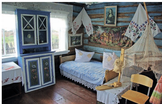
«Мари ызбасы» этномәдәни комплексы.

яңа ел чыршысын иң матур бизәү буенча республика конкурсында жиңү яулаганнар. Кардан скульптуралар белән бизәлгән бәйрәм майданыннан тыш, авылдагы күп кенә утарларда да кар сыннар куелган.