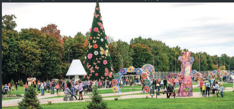
Узган ел Татарстанда 140тан артык ял зонасы барлыкка килде, күбесе икенче сулыш алды.