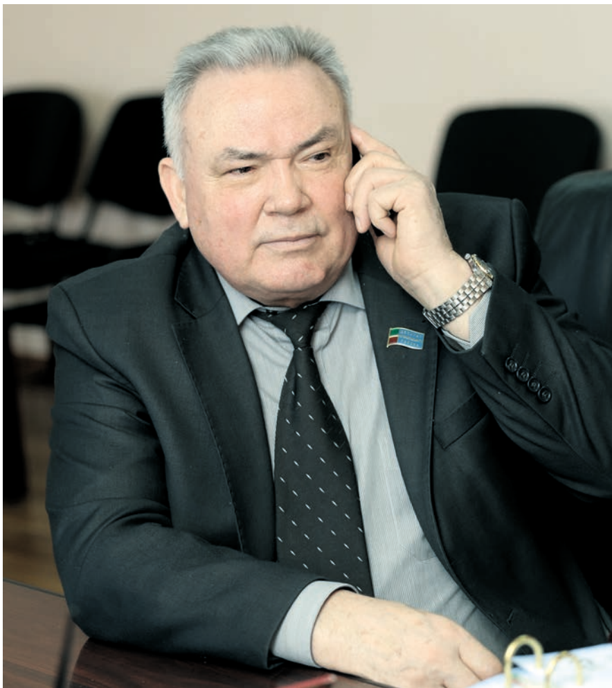
Лилия НУРМӨХӘММӘТОВА тексты.