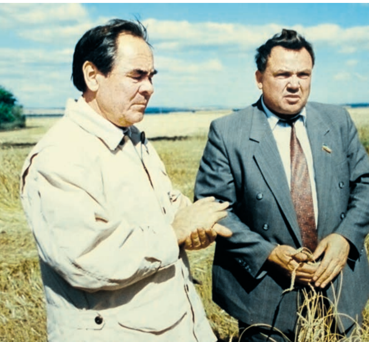
ТР Президенты Минтимер Шәймиевнең Тәтеш районына эш сәфәре. (1990нчы еллар).

хоз зур, 6 мең гектар жирне тиешенчә эшкәртеп, чәчеп чыгарга кирәк. Партоешма житәкчесенә таяныр идең, укытучы кеше, чәчүнең нечкәлекләрен белми. Техникумда алган белемнәрен эшкә жигеп, белмәгән китап-дәфтәрдән укып, чәчүне башкарып чыга. 8 майда чәчүне бетереп, 10 майда Совет Армиясенә китә.