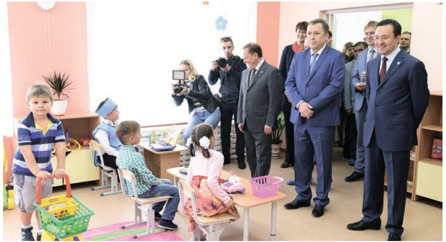
2015 елда Түбән Камада 260 балага исәпләнгән «Сөөнеч» балалар бакчасы куллануга тапшырылган.

Хәзер яңартылган китапханә чын иҗтимагый үзәккә әйләнгән. Ачылып бер-ике ай үтүгә үк, анда йөрүчеләр саны ике-өч тапкыр арткан.