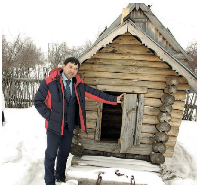
Башлык Убырлы карчыкның күчмә ызбасына керергә чакыра.

Жирлектә күп эшләр федераль, республика һәм жирле программалар кысаларында башкарылган. Бары тик грантлар формасында гына да жирлек соңгы ике елда 600 мең акча алган. Әлеге акчаларга клубны жиһазлаганнар, мәктәп өчен техника һәм спорт инвентарьлары сатып алганнар. 300 меңен күптән түгел генә отканнар, жирлекләрдә үзәк