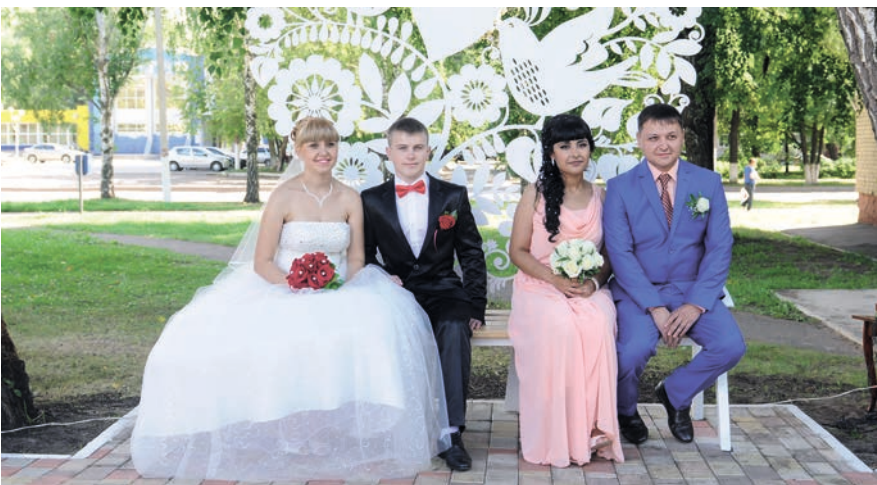
Нәтиҗәдә бер-ике ай эчендә шәһәрнең төрле почмакларында, калага үзәнә бертөрле ямь өстәп, 30 өр-яңа үзәнчәлекле эскәмия пәйда булган.

Түбәнкамалылар территориаль иҗтимагый үзидарәне үстерүдә әйдәп баручылардан берсе булып тора. Шәһәрдәге ТИУ хәрәкәтенә инде 16 ел, биредәге микрорайоннарда 25 Территориаль иҗтимагый үзидарә советы исәпләнә. Совет чикләре депутат округлары чикләре һәм полициянең участок вәкилләренә беркетелгән чикләр белән тәңгәл килә. Һәр ТИУС эшчәнлегә зонасында 7дән 14 меңгә кадәр кеше яши.