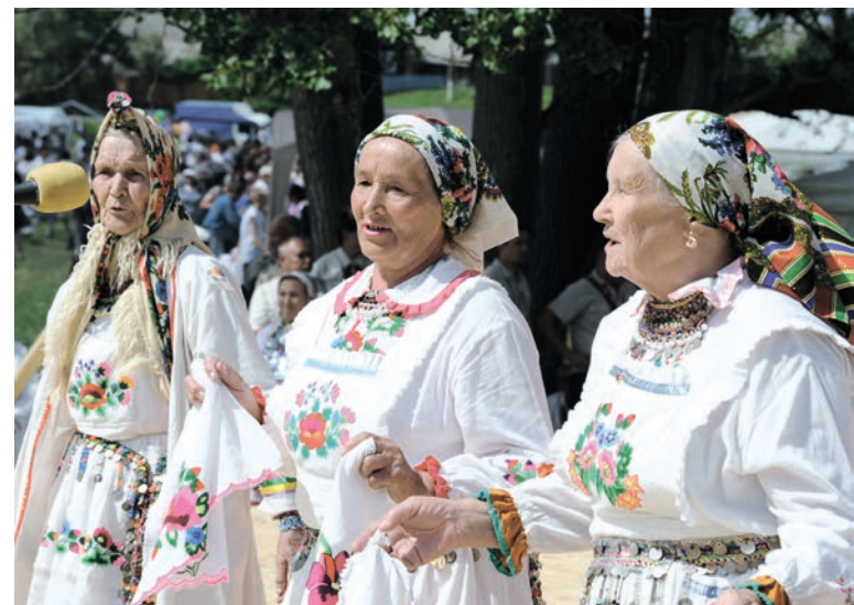
Безнең Күклюк әбиләре.

Мари халкы бер-берсе белән элементләрен жуймаска тырыша. Күклюк ансамбле концертлар белән башка мари авылларына бара. Ә Иске Күклюкка еш кына Йошкар-Ола-