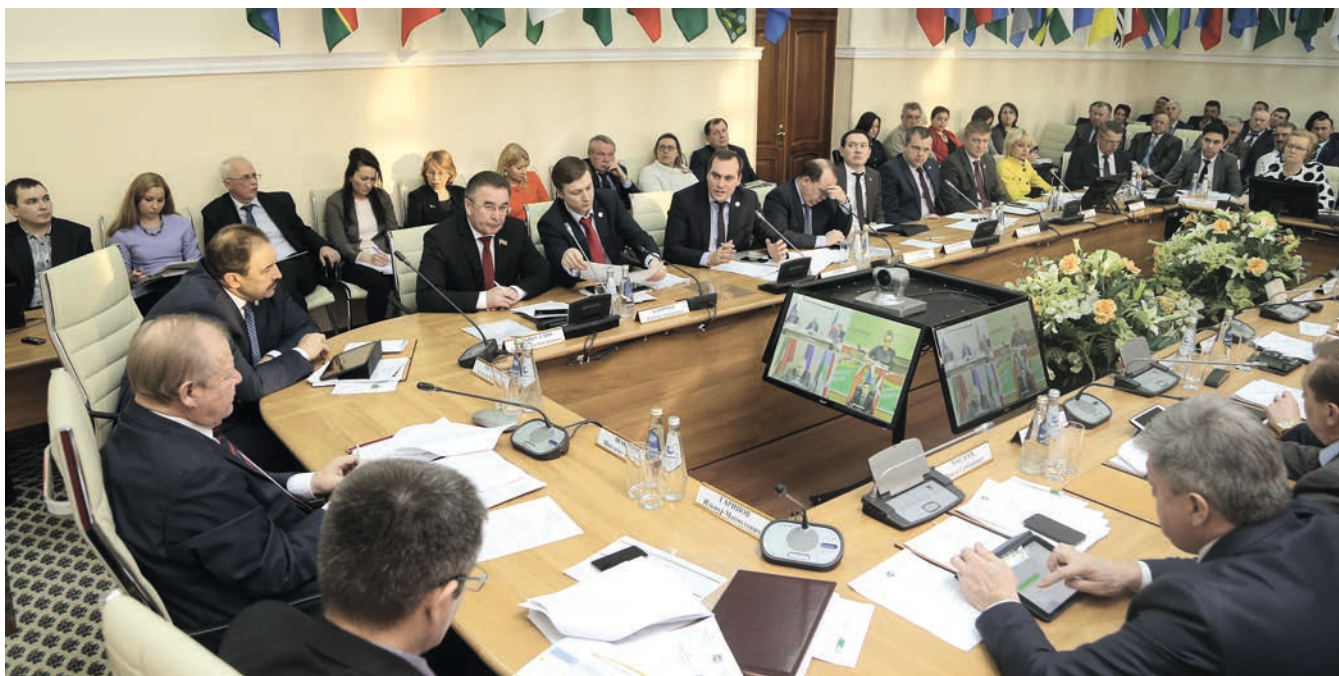
Совет Президиумының киңәйтелгән утырышы үзен нәтижәле эш форматы итеп күрсәтте.

нун нигезләмәләреннән чыгып, 2006 елның мартында Татарстан Республикасы Муниципаль берәмлекләре Советы (ТР МБС) оешты. Беркадәр соңрак Муниципаль берәмлекләренң гомумроссия конгрессы (МБГК) барлыкка килде, без дә аның әгъзасы булдык.