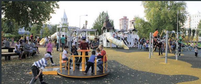
Казанда «Континент» паркы.