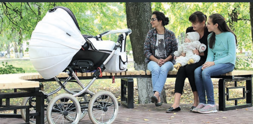
Парк һәм скверларны төзекләндерү бюджеты 1 млрд сумны тәшкил итте.