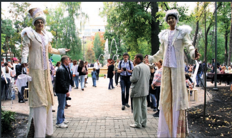
Татарстан башкаласында яңартылган Лядской бакчасы.