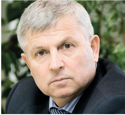
Виктор КИДЯЕВ, РФ Федераль Жыены Дәүләт Думасының Федератив корылыш һәм жирле үзидарә мәсьәләләре комитеты рәисе, Муниципаль берәмлекләренң гомумроссия конгрессы президенты