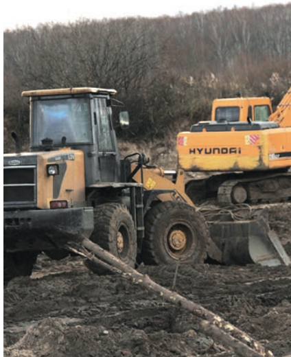
Яңадан торгызу эшләренә миллионлаган сум акча китә.