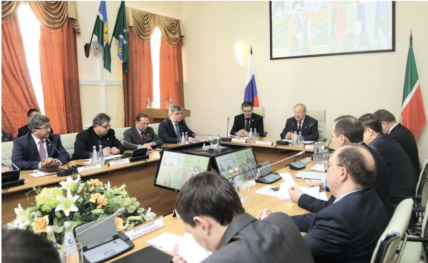
Нияз ӘХМӘДУЛЛИН тексты.