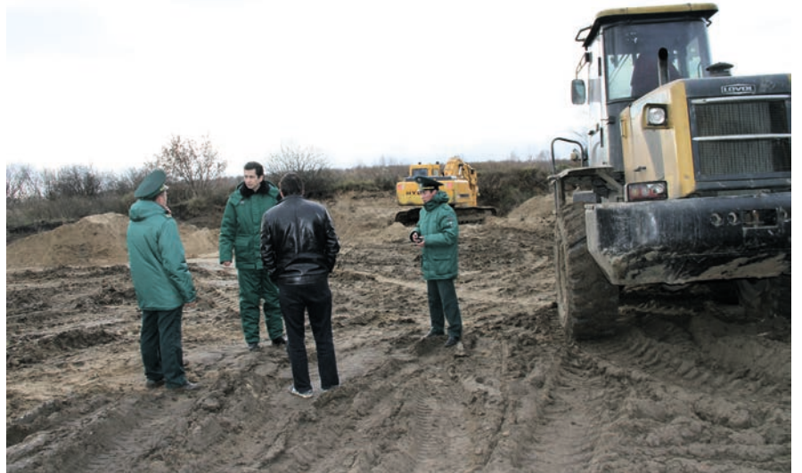
Соңгы елларда республикада карьерлардан файдалану буенча контроль көчәйде.

Кагыйдә буларак, карьерларны рөхсәтсез казыганда дәүләт теркәү билгеләре булмаган техника файдаланыла. Рейд барышында техниканы ташлап качу очраклары да шактый – бу вакытта административ материалны теркәү катлаулана. Бер нәрсә кала – транспорт чарасын штраф тукталышына кайтарып кую. Бу дәлил тиз арада хужаны табарга һәм закон бозучыны ачыкларга ярдәм итә.