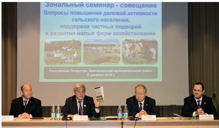
Авылда кешенең эшлекле активлыгын үстерү — республика житәкчелеге, муниципалитетлар башлыклары, фермерлар һәм ШЯХ башлыклары катнашлыгында уздырылган зона семинарларының төп темасы.

лы рәвештә, 120 һәм 119 процент тәшкит иткән.