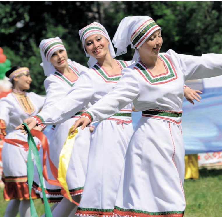
«Семьк» Республика традицион мари мэдәнияте бэйрәме (Иске Күклюк авылы).

Жирлектә барлыгы 500 кеше яши, шуларның 70 проценты мари-лар. Руслар татарлар, керәшеннәр, азербайҗаннар бар. Дус-тату яшиләр. Күп кенә марилар туган телләре һәм рус телен белүдән тыш, татарча да сөйләшәләр. Мари теле мәктәптә факультатив рәвешендә өйрәнелә. Традицион мэдәниятне саклауда халык ансамбльләре зур роль уйный.