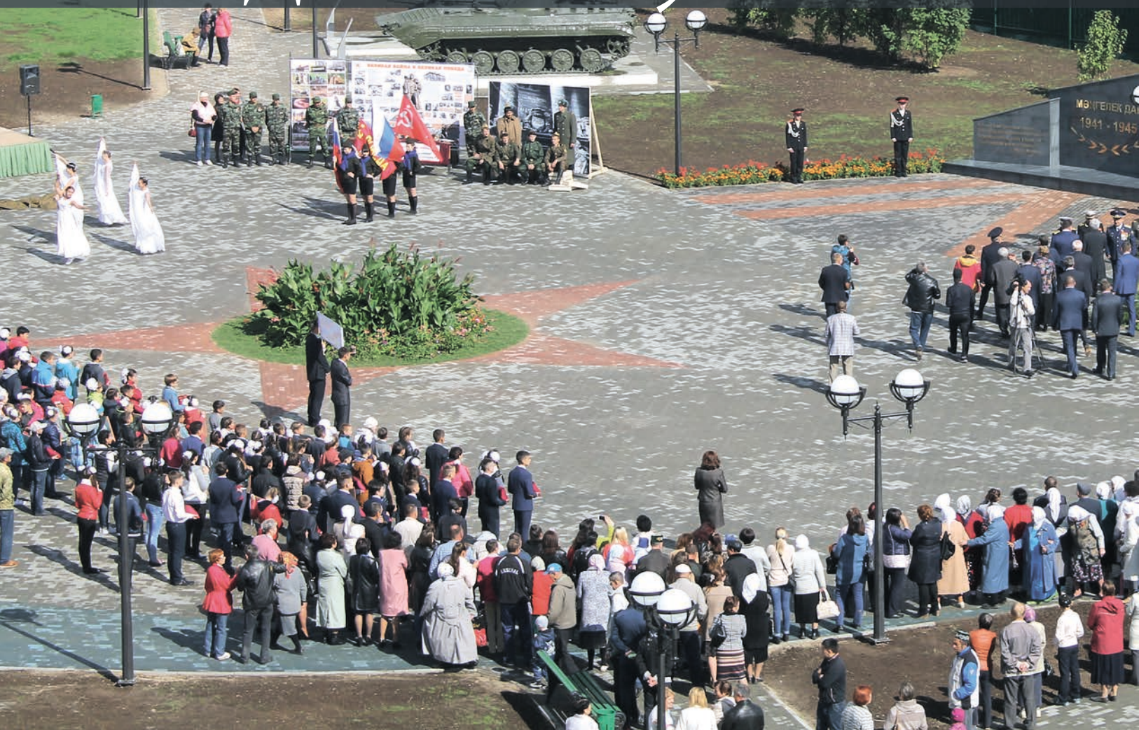
Арчада Жиңүнөң 70 еллыгы паркы.