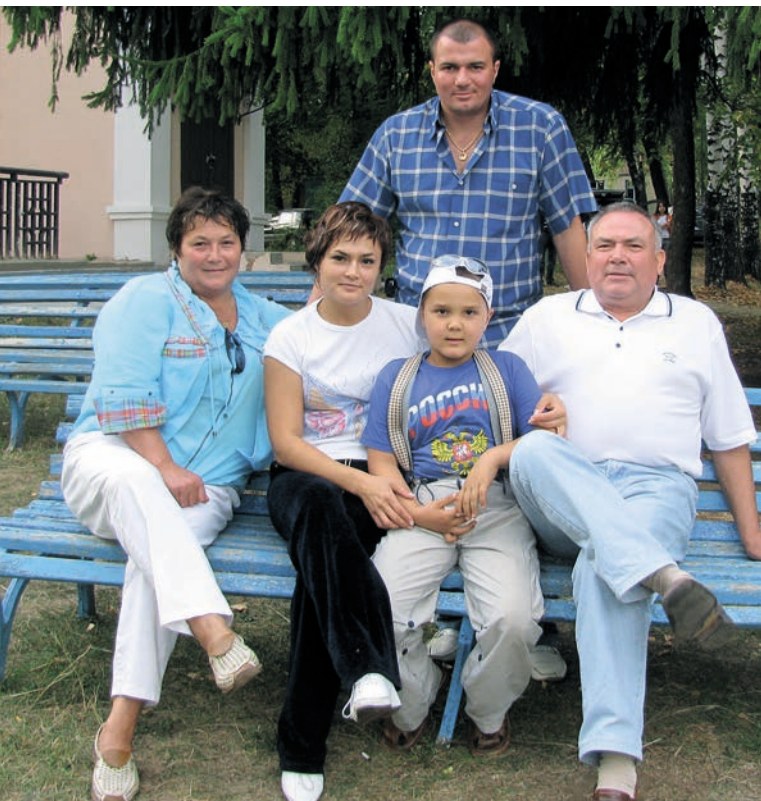
Бөтен гаилә жыелганда.