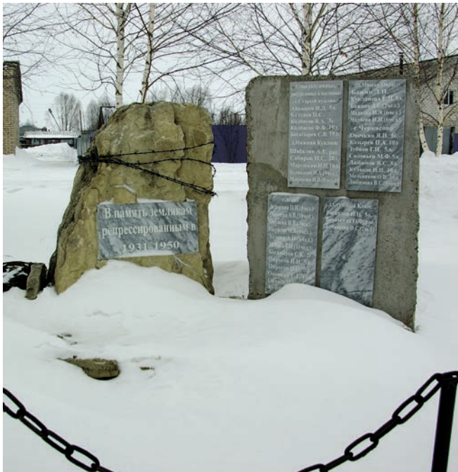
Репрессия корбаннары истәлегенә һәйкәл – кайбер гаиләләр 10–20 кешесен югалтканнар.

ма тырмалау һәм маллар карау физкультура белән шөгыльләнгәндәге кебек файданы бирми.