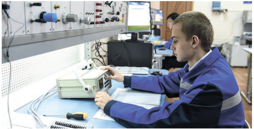
Түбән Кама нефть химиясе һәм нефть эшкәртү техникумы шәһәрдәгә сәнәгать гигантлары өчен эшче кадрлар әзерләү урыны булып тора.

Шәһәр халкы фонтан, Су анасы, Былтыр, Шүрәле, Кәжә, Сарык һәм Тукайның башка әсәрләре персонажлары сыннары куелган, яхшы яктыртылган парклы булган. Биредә газоннар бик пөхтә, жәяүлеләр һәм велосипедчылар өчен юллар ясалган, уңайлы эскәмияләр куелган, татар йорты, шулай ук шигырьләр уку өчен сәхнә бар. Парк территориясенең өчтән бер өлешен төрле яшәтгә балалар өчен спорт-уен зонасы алып тора.