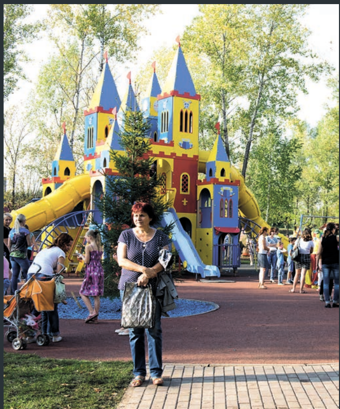
2015 елда Яр Чаллыда 9 парк һәм сквер төзекләндерелде.