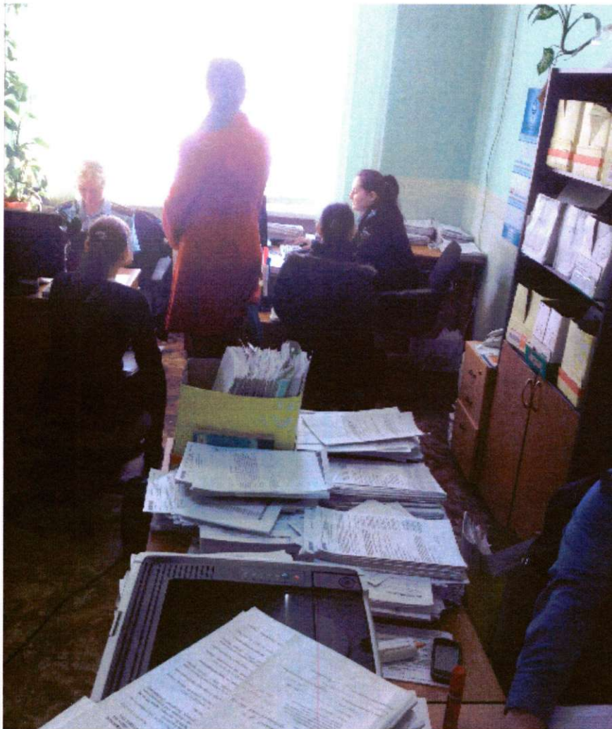
Вахитовский межрайонный отдел судебных приставов (аренда помещения у ОАО «Татстрой»)

Помещения Вахитовского межрайонного, Межрайонного отдела судебных приставов по особым исполнительным производствам, Советского районного отдела не отвечают современным требованиям.