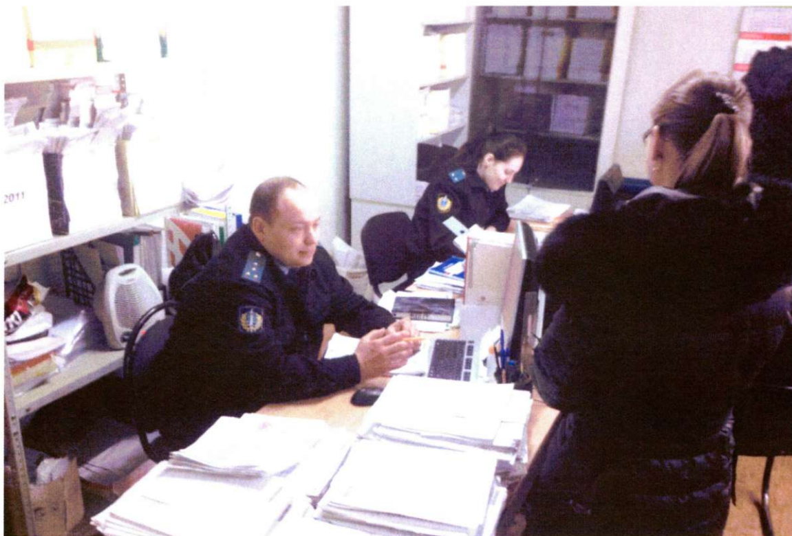
Вахитовский межрайонный отдел судебных приставов (аренда помещения у ОАО «Татстрой»)