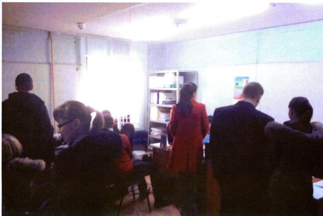
Вахитовский межрайонный отдел судебных приставов (аренда помещения у ОАО «Татстрой»)