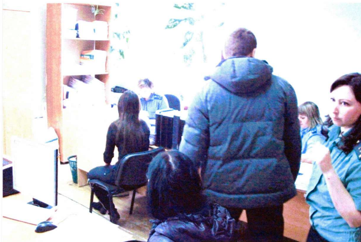
Советский районный отдел судебных приставов

Нагрузка по исполнительным производствам в Советском отделе превышает среднереспубликанскую в полтора раза, в 2012 году предстоит расширение штатной численности данного отдела, и условия как для работников, так и для посетителей ухудшатся (в настоящий момент в Советском отделе приходится на одного работника 7,6 квадратных метров кабинетной площади при положенных 9).