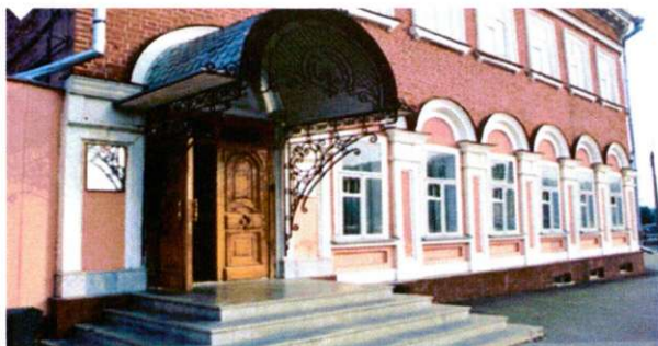
Ул. Р.Яхина, 3

- помещение по ул. Шаяпина, д.51, общая площадь 817 кв.м., полезная – 708, договор безвозмездного пользования, форма собственности – республиканская (Министерство земельных и имущественных отношений Республики Татарстан).