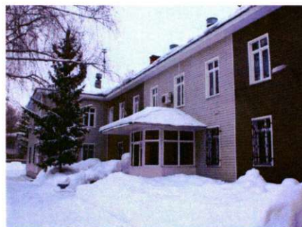
Ул. Шаяпина, 51