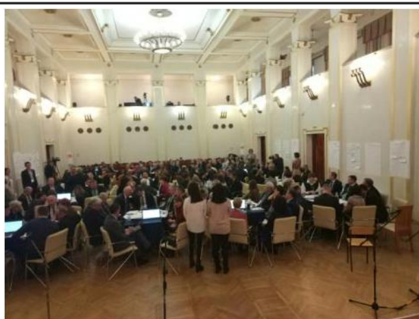
Общий план, вид зала со сцены.