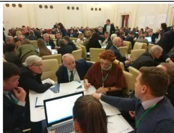
Рассадка по столам и рабочая атмосфера.