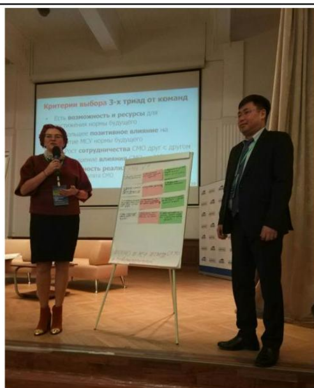
Выступления команд по отобранным триадам

Ниже приводится выбранный при голосовании всеми участниками сессии список из семи наиболее актуальных триад для разработки мер по достижению желаемого будущего.