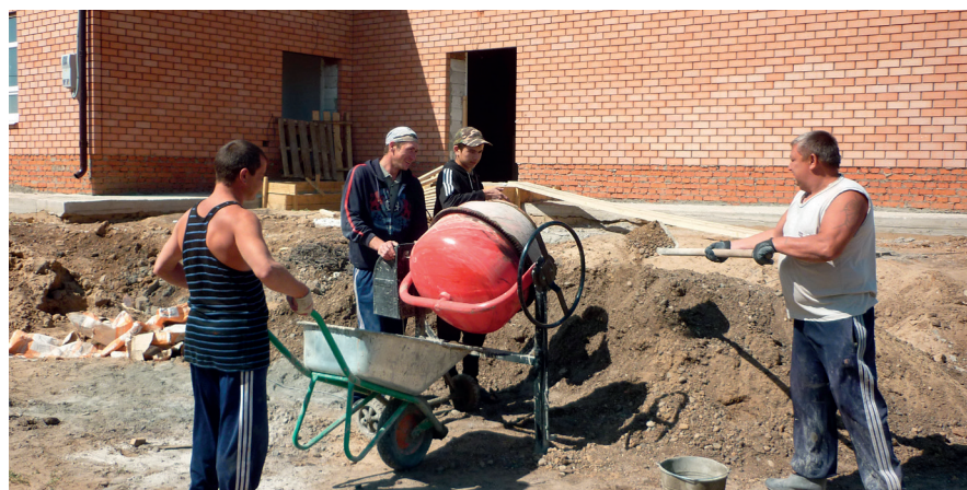
В селе Азбаба полным ходом идет строительство многофункционального центра.

Азбаба – интересное село. Исторически так сложилось, что здесь бок о бок живут татары и чуваша. Одна половина села – татарская, другая – чувашская. На одной половине строится