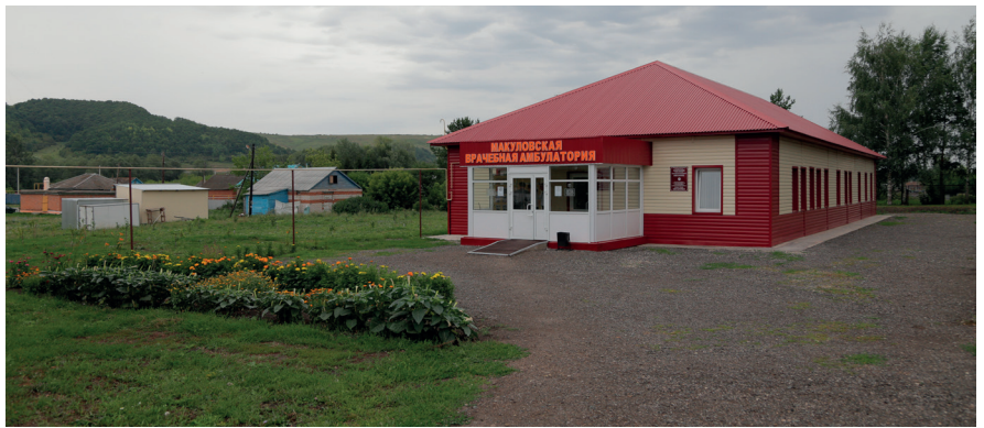
Недавно была капитально отремонтирована врачебная амбулатория в селе Макулово и проведен ремонт амбулатории в селе Шеланга.

лили дополнительное финансирование в размере 15 млн. рублей. На эти средства здесь привели в порядок восемь улиц Верхнего Услона. На дорогах, давно не видевших ремонта, помимо «ямочного», наконец-то появился асфальт и щебеночное покрытие.