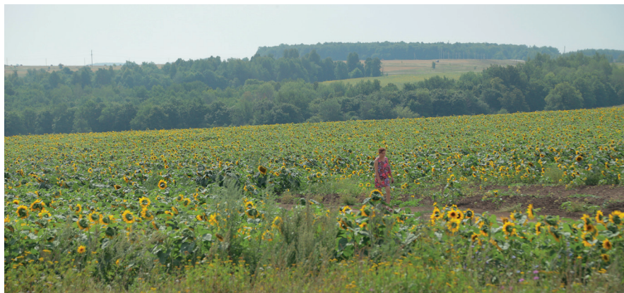
В районе проходит полная ревизия земель. Данная работа идет в двух направлениях: это ревизия сельскохозяйственных земель и ревизия земель, расположенных на территориях сельских поселений.

В Верхнеуслонском районе решили не торопиться с самообложением и идти вперед постепенно. «Вопрос в том, ка-