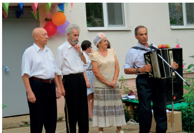
Праздник двора в ТОС №1.

Учиться новому делу было не у кого. Реально действующих