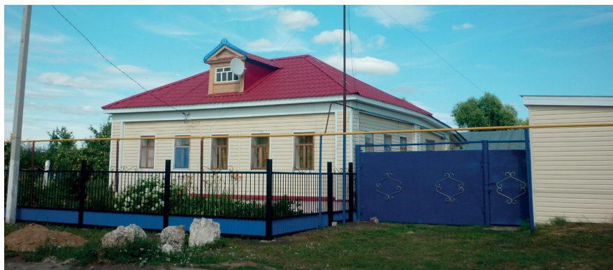
Сегодня во многих селах – добротные газифицированные дома, многие под профильным настилом, облицованные кирпичом, с красивыми фронтонами и воротами, на отдельных улицах – асфальт.

мечеть, на другой – церковь. При этом создается впечатление, что все здесь знают и татарский, и чувашский языки, поскольку сельчане с малолетства общаются друг с другом, ходят в один детский сад, в одну школу.