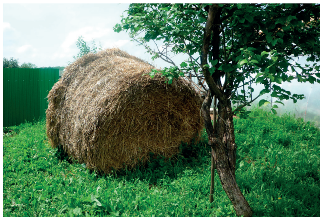
Корма предприниматели выращивают на 22 гектарах земли, арендованной у пайщиков. Дополнительно покупают сено и зерно у знакомого фермера в соседней Кировской области.