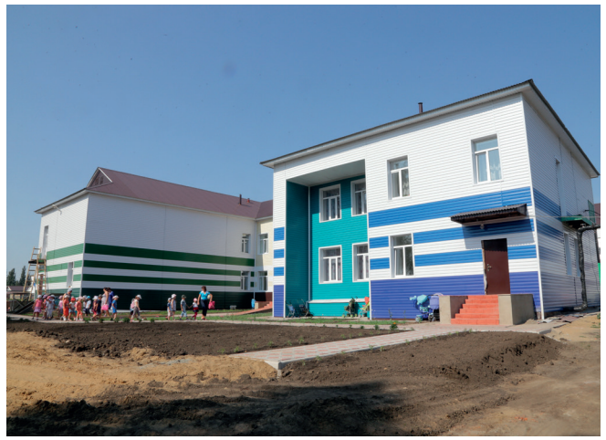
В текущем году в Буинске капитально отремонтировали два детских сада.

моны», «Русская песня», «Созвездие – Йолдызлык». В 2015 году в Буинске в рамках федеральной целевой программы начнется строительство культурного центра.