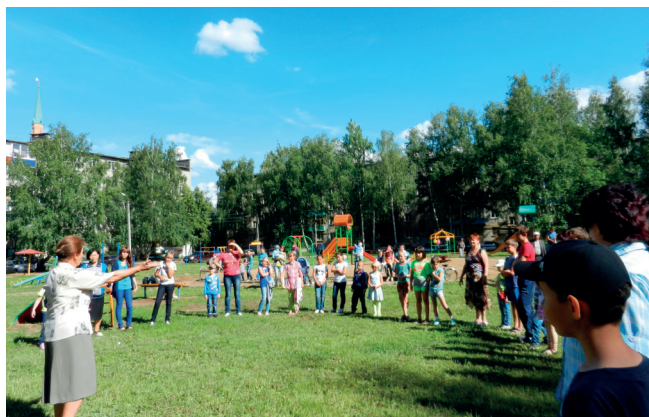
О ТОС многие жители узнают через детей – в микрорайоне проходит много детских праздников, и ребята возвращаются домой с охапками призов.

Людей расшевелить, объединить, организовать несложно, считает председатель ТОС. Что касается вновь созданных ТОС,