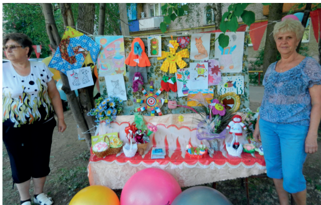
Благотворительная акция в ТОС №2 в помощь приюту для животных.