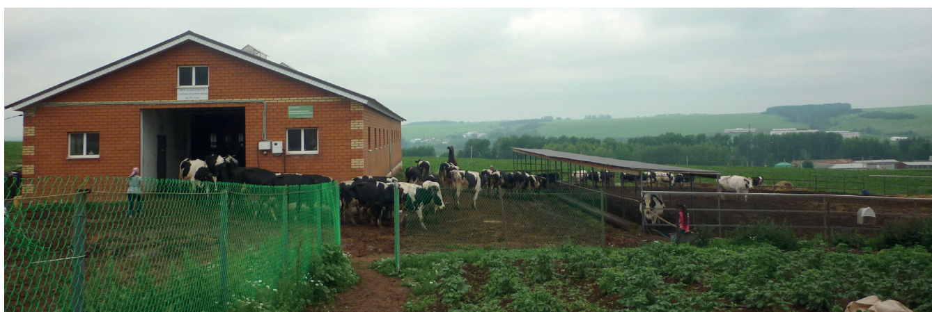
Строительство фермы обошлось недешево, пришлось взять в банке кредитов на 4 миллиона рублей. С залогом помогла администрация района, выделив муниципальное имущество.

ренки Чулпан и Юлдуз, к примеру, получают побольше, ведь они дают в сутки по 35 килограммов молока. А средний надой составляет 18,5 килограмма, что тоже очень даже прилично. Ежедневно на продажу накапливается 500 килограммов. Молоко вывозится опять-таки на ферму СХПК «Урал», где ведется его раздельный учет. Поскольку фермерское молоко качественное, то и оплачивается оно сельхозпредприятием по цене высшего сорта. Налицо такое вот мирное сотрудничество «колхоза» и частного хозяйства.