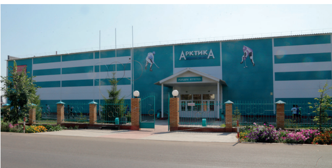
Настоящим украшением Буинска является ледовый дворец «Арктика», график занятий в котором расписан на неделю вперед.