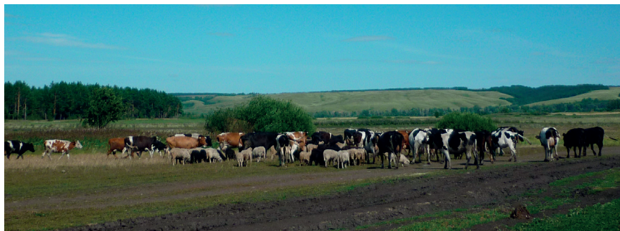
Хозяйство держится на четырех сотнях голов крупного рогатого скота, из которых 260 – дойные коровы, дающие по 8-9 килограммов молока на буренку.