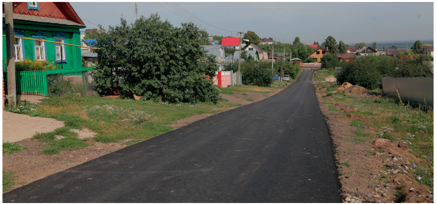
На дорогах, давно не видевших ремонта, помимо «ямочного», наконец-то появился асфальт и щебеночное покрытие.

В рейтинге, составляемом Минэкономки РТ, район по итогам первого полугодия 2014 года занимает 16 место среди 45 муниципальных образований республики, по сравнению с предыдущим полугодием прогресс составил одну позицию. Если же считать строго по сельским районам (что, безусловно, дает более объективную картину), то район находится на 6 месте.