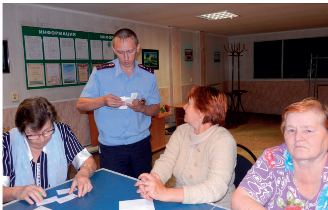
Председатели домовых комитетов играют важную роль в профилактике правонарушений.

Отдельная история – борьба с начислениями на общедомовые нужды (ОДН), которая, кажется, завершилась победой жителей. Но поработать пришлось немало. Чтобы снизить платежи за общедомовые нужды, решили с помощниками обходить дома и одновременно собирать показатели счетчиков. С каждым проводили беседы, стараясь все разъяснить. Попутно выявились неблагополучные квартиры, а также квартиры с «нулевыми счетами», сданные в аренду.