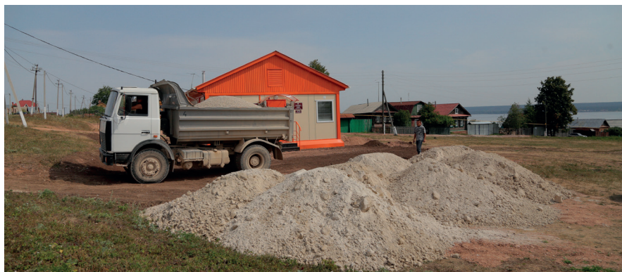
В Октябрьском сельском поселении, в момент нашего приезда, готовились к торжественному открытию новенького ФАПа.