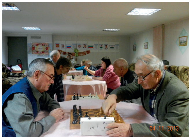
В ТОСах действуют различные кружки по интересам.

Собрания, на которых избирались советы и председатели ТОС, проходили по-разному. Где-то был полный зал, где-то жители откликнулись не так активно. По мнению организаторов собраний, это нормально: процесс самоорганизации и роста самосознания – длительный. Если посмотреть на опыт ТОСов, в которых жители охотно участвуют в жизни микрорайона, то здесь тоже ведь не все сразу получилось. Активность формировалась все эти годы.