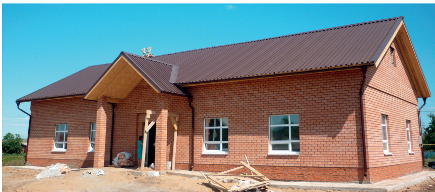
В селе Верхнее Аткузино на средства гранта строится клуб.

С согласием сельчан на самообложение, когда к каждому собранному у населения рублю добавляется четыре рубля из республиканского бюджета, возможности по увеличению темпов строительства дорог расширились. Во всяком случае, практика показывает, что многие сельские населенные пункты, используя средства, собранные в результате самообложения, начали строить щебеночные, то есть более дешевые дороги.