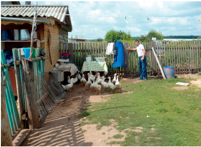
После работы – опять работа, теперь уже в доме и на участке.