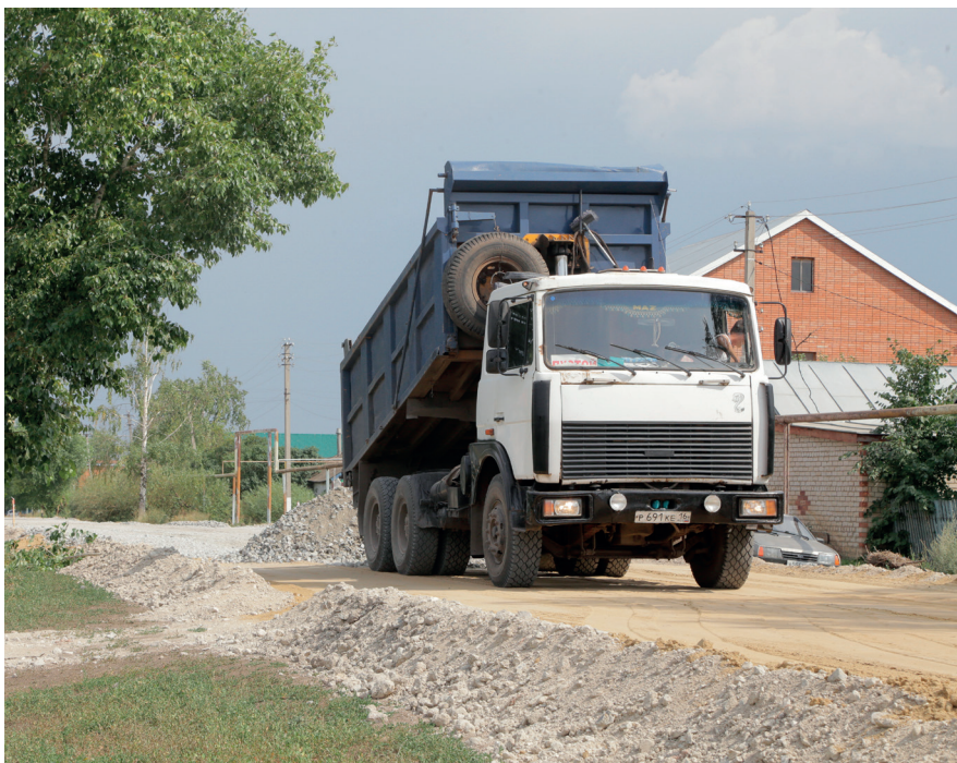
Основной вопрос, который волнует большинство васьильевцев, это отсутствие в поселке асфальтированных дорог, большая часть из них не имеют вообще никакого покрытия.

Но не везде все проходит гладко, к примеру, в селе Татарский Кандыз Бавлинского района референдум по самообложению по причине низкой явки не состоялся – из 699 зарегистрированных избирателей в референдуме принял участие 31 процент, из них 86 процентов поддержали инициативу местной власти. Хотя нужно признать, что подобная ситуация скорее является исключением, чем правилом.