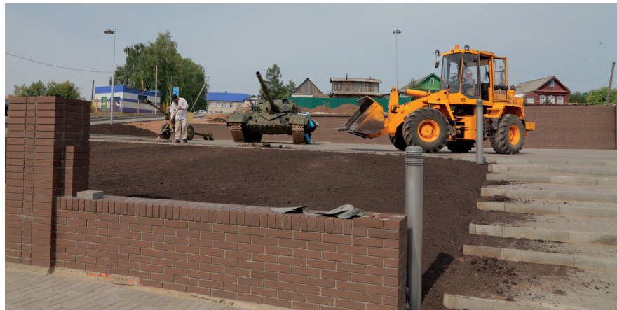
В центре Верхнего Услона строится парк Победы, в котором разместится техника военной поры, а также будут разбиты клумбы и цветники.

Родился 16 августа 1970 года в с. Макулово Верхнеуслонского района РТ. В 1992 закончил Казанский государственный сельскохозяйственный институт, по специальности – инженер-механик. Работал в совхозе «Знамя Ленина», машинно-тракторной станции, ОАО «Красный Восток – Агро», ЗАО «Восток Зернопродукт», заместителем руководителя и руководителем Исполнительного комитета Верхнеуслонского муниципального района Республики Татарстан. 11 марта 2012 года избран главой района – председателем Совета Верхнеуслонского муниципального района Республики Татарстан.