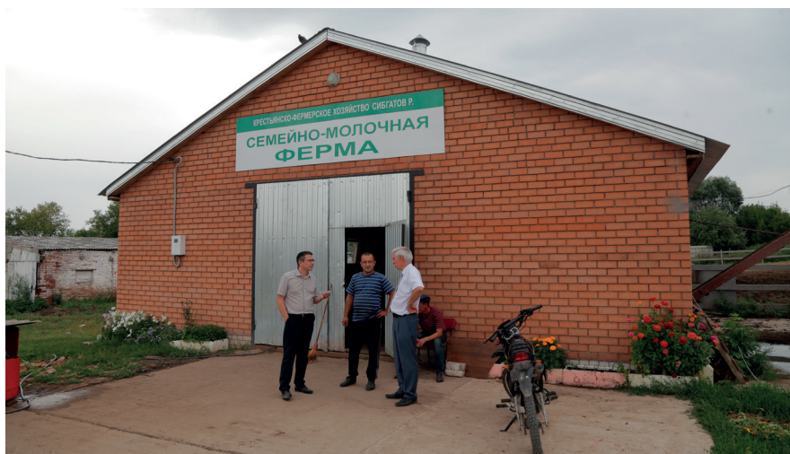
Фермер хотел бы расширить хозяйство, увеличить поголовье, однако, пока непонятно, как и за счет каких ресурсов.