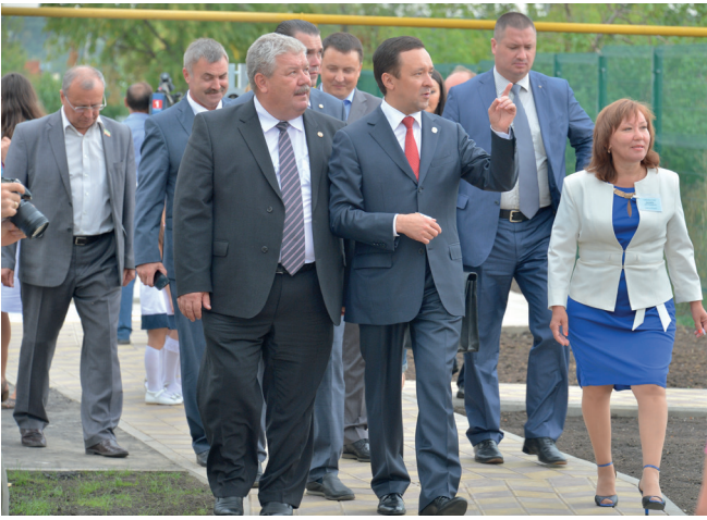
Премьер-министр РТ Ильдар Халиков на открытии детского сада «Ак Каен», в котором нынче был проведен капитальный ремонт. 4 года назад он был закрыт из-за аварийного состояния здания.

городское поселение, проживают единой семьей 44,5 тысячи татар, русских, чувашей и представителей других национальностей. Решением представительства ЮНЕСКО в Российской Федерации в 2001 году Буинский район и город Буинск награждены Золотой медалью «Пальмовая ветвь мира».